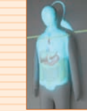
立体画像で臓器を解説