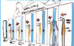
メタボリックチェックゲート